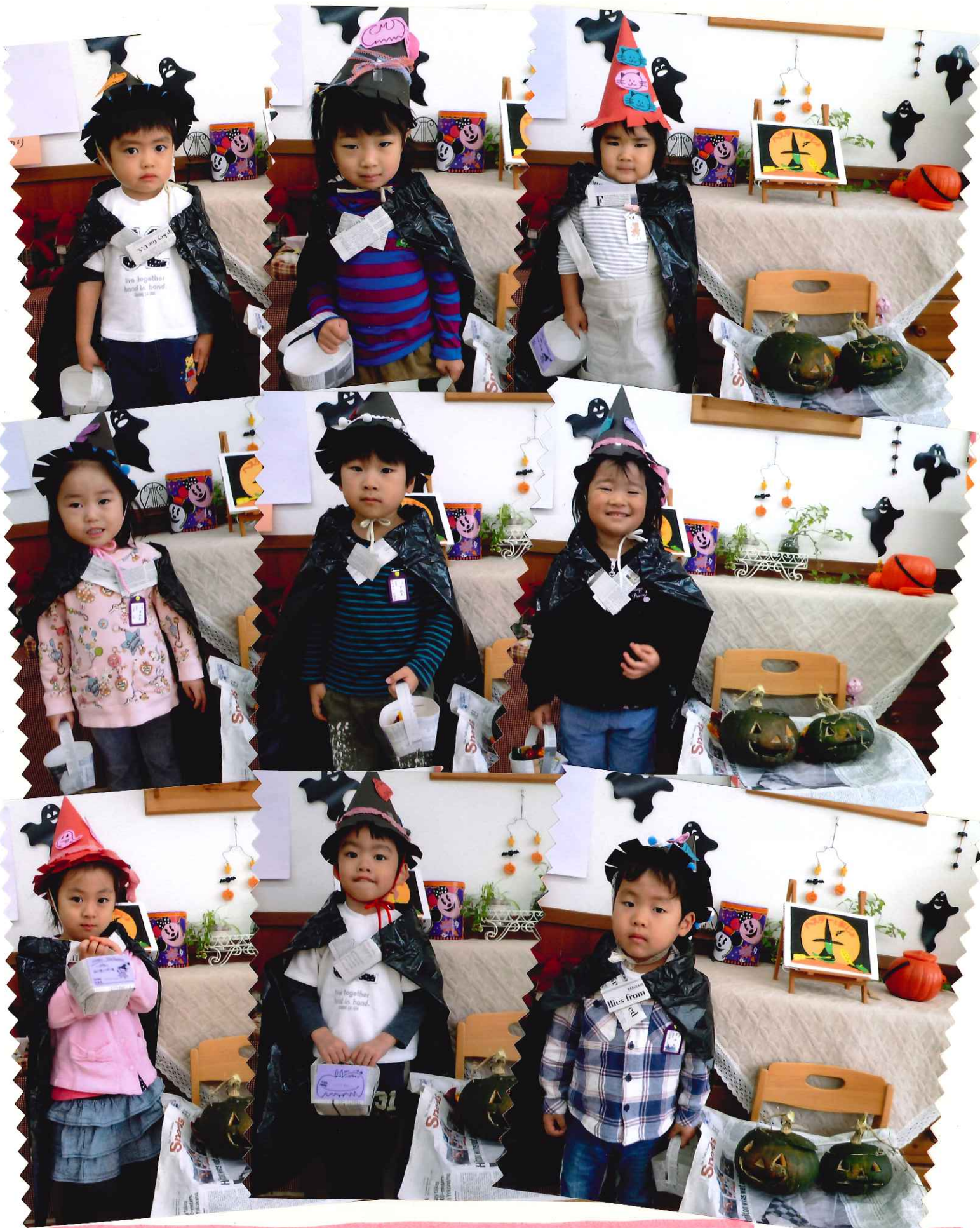
子どもたちが身に付けている. 帽子, マント, バックは, バザー係の方の手作りです! 子どもたちが「ハロウィンを楽しむように...」と, 企画して下さいました。 ありがとうございます。大喜びの子どもたちでした♡♡♡